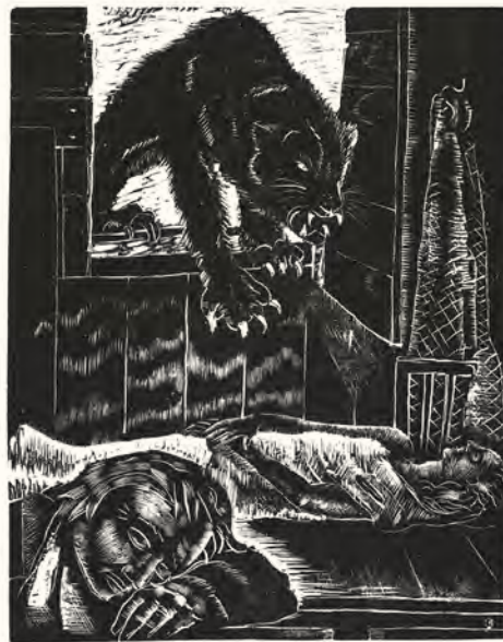
Jeanne Oosting, illustratie Soldaten en burgers van Ambrose Bierce, houtgravure, 1949.