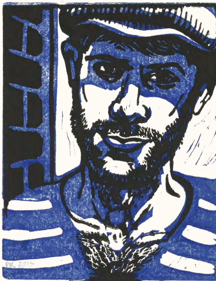
Peter Kooij, Petman , lino, 2013, 135 x 100 mm.

Peter Kooij werkt graag in lino. Elke kunstenaar kiest wellicht de techniek die het beste bij hem of haar past. Buiten tekenen met potlood is op zijn lijf geschreven. Hij mag graag even een landschap, een dorpsgezicht, een kerk of andere gebouw in zijn schetsboekje vastleggen. Speels, sfeervol en treffend tegelijk zijn deze tekeningen en schetsen. In zijn techniek in de lino lijkt het erop dat hij dat wil herhalen een beetje speels en vlot de guts door het linoleum jagen al maakt hij heel precies het ontwerp in potlood. Dat ontwerp moet het spel van zwart en wit dienen. We leven in het tijdperk waarbij kleuren in de prentkunst de volle aandacht krijgen. Werk met een geraffineerde balans in een sterke zwart-wit werking krijgt minder de aandacht. Dat is jammer.