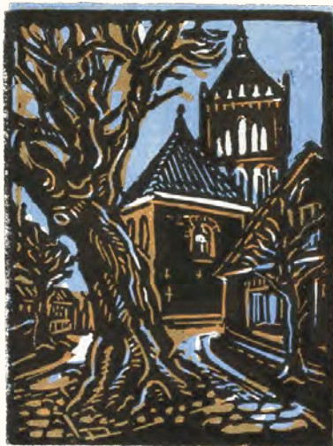
Peter Kooij, Ost-Friesland , lino, 2009, 95 x 72 mm.

> Peter Kooij, Taormina , lino, 2016, 115 x 82 mm.