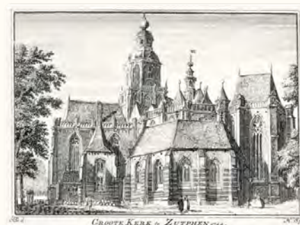
GROOTE KERK te ZUTPHEN 1744.

Zutphen is een wonderschone stad, vol van geschiedenis en monumenten. Het regent er nieuwe geschiedenisboeken en de Hanzestad is blijvend een inspiratiebron voor kunstenaars. Alleen al in het boek Ingelijst, vier eeuwen Zutphense schilderkunst van Wouter Derksen kunnen er 350 kunstenaars geteld worden. Een tentoonstelling en een thema-nummer van Grafiekwereld zijn slechts een keuze uit het vele schone, dat Zutphen en haar kunstenaars te bieden hebben. Als het bijdraagt aan uw voorname Zutphen eens te bezoeken, dan is de missie al geslaagd. Geniet met volle teugen!