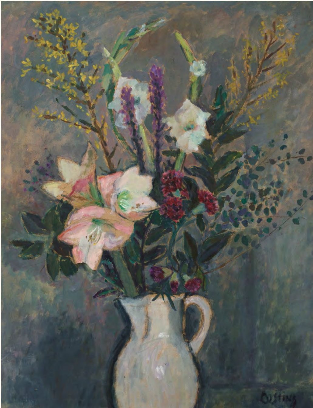
Jeanne Oosting, Bloemstillevens , olieverf, z.j., 880 x 685 mm (Nobilis collectie, aankoop 2019 Collectie Van Buuren, Zutphen).