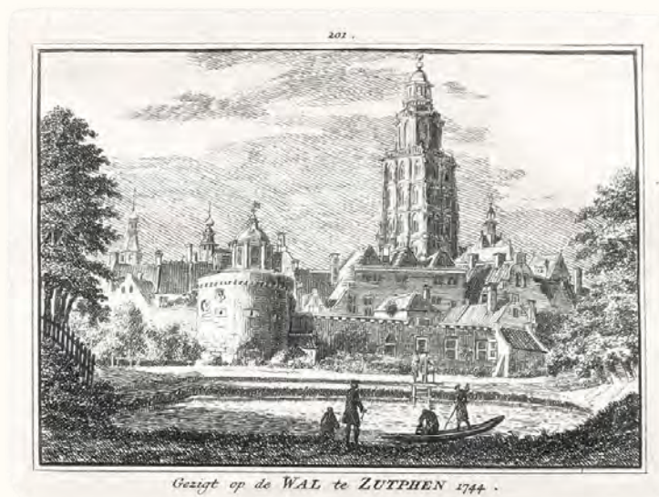
Gezigt op de WAL te ZUTPHEN 1744.