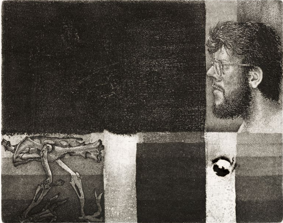
Hans Blanken, In de zomernacht kijken , ets, aquatint en vernis mou, 23 juni 1969, opus 20, dit is nummer 5/12, oplage 12 exemplaren, zink, 145 x 182 mm, gedrukt op Koperdiepdruk Van Gelder 360 gr.

werkt hij gedurende de zomer stug door, telkens wanneer een zekere partij voltooid is een proefdruk makend. In september (hij noteert alles zorgvuldig) trekt hij voor het laatst een proef. Alle fasen in het werk houdt hij precies bij, etstijden, inkt, papiersoort, datum. Alle proeven (een indrukwekkende stapel) bergt hij in een map, de map gaat samen met de aantekeningen in een laadje. En tenslotte drukt hij van de koperplaat twaalf bladen die tot de indringendste grafiek behoren die er bestaat. Het zijn heel gewone dingen eigenlijk die Hans Blanken tot onderwerp kiest. Beelden uit zijn geboortestreek rond Bergambacht, een oud huisje langs de dijk, het terpdorpje Wanswerd waar zijn atelier op uitkijkt, herinneringen aan Curaçao, enkele kleine stilleventjes van liefdevol geobserveerde bermvondstjes. Heel gewone dingen dus, maar ze lijken op magische wijze tot stand gekomen te zijn. Hans Blanken tekent niet! Nooit geeft hij een omschrijving van de dingen door een contour te trekken. Nooit suggereert hij de volumes ervan door te arceren. Hij beschrijft niet, hij wil dat de dingen zelf lijfelijk aanwezig zijn. Alsof er geen teke-