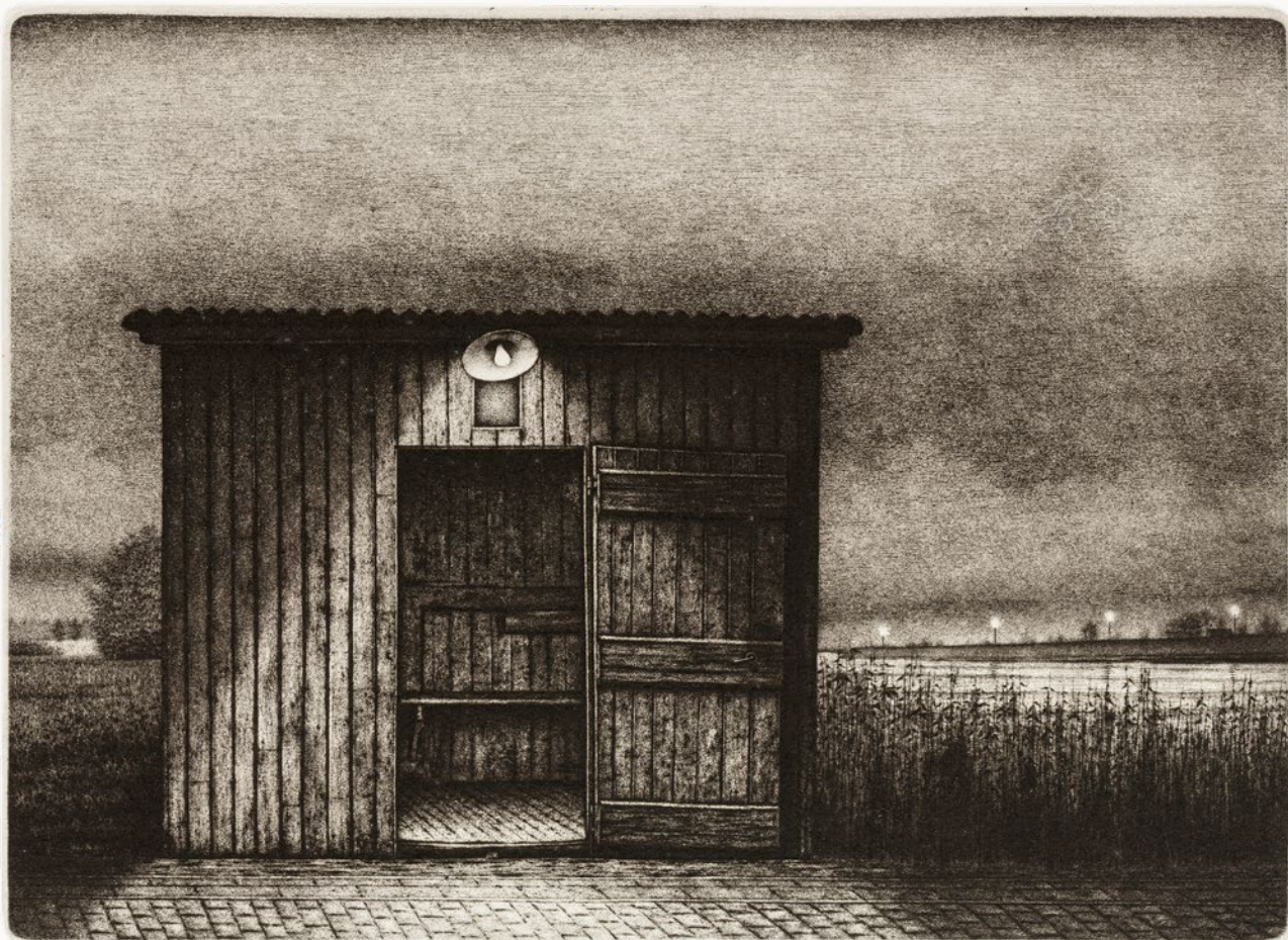
Hans Blanken, Bergstoepse veer, ets en aquatint, 24 oktober 1977, opus 75, 25 staten, oplage 30 exemplaren, koper, 158 x 215 mm, gedrukt op Hahnemühle 300 gr, met als inkt zwart van Le Franc en karmijn.