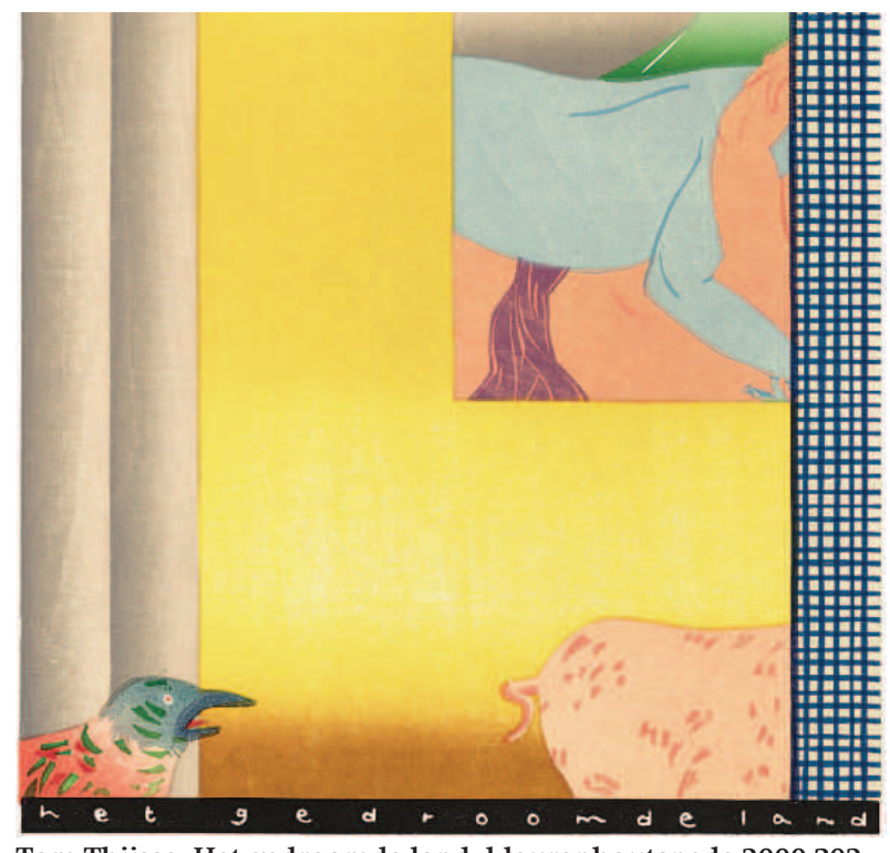
Tom Thijsse, Het gedroomde land, kleurenhoutsnede 2000 302 x 300 mm.