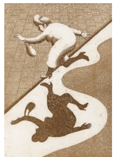
Plas, ets en aquatint, 2004, 395 x 295 mm.