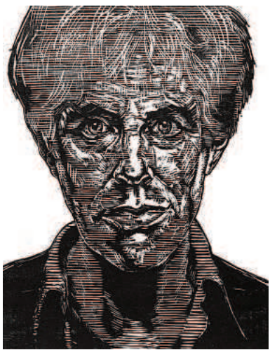
Zelfportret, z.j., houtsnede, 344 x 293 mm.

In het centrum van prentkunst staat de komende maanden het grafisch werk van kunstenaar Herman Gordijn centraal. Stichting Nobilis houdt hiermee de eerste overzichtstentoonstelling van zijn grafiek.