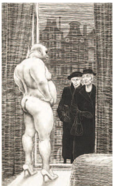
Oudekerksplein, toyobo-ets, 2016, 275 x 170 mm.

Herman Gordijn overleed in mei 2017 net voor de aanvang van een grote tentoonstelling in museum MORE in Gorssel, waar hij nog actief aan de voorbereiding had bijgedragen. Hij werd geboren in Den Haag en kreeg zijn opleiding in die plaats aan de Koninklijke Academie van Beeldende Kunsten en de Vrije Academie. Aan die laatste gaf hij later zelf les, en ook aan de Rietveld Academie in Amsterdam. Vanaf 1960 woonde hij in Amsterdam en vanaf 1984 had hij tegelijk een woon- en