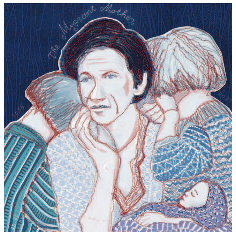
Sietske Bosma, The Migrant Mother, lino'snede gt, 2021, 500x500 mm.

Dubbele prenten worden verkocht voor geschikte prijzen