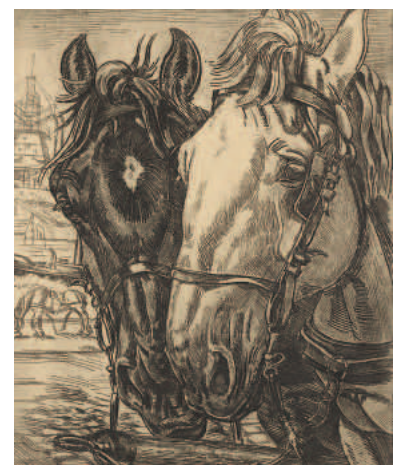
Vier werken van Kuno Brinks: V.I.n.r.: Koeien, tekening, z.j., 300 x 220 mm.; IJsseldijk, ets, 1942, 168 x 221 mm.; Portret Jan Sluijters, kopergravure, 1958, 334 x 275 mm.; Twee paardenhoofden, ets, 1929, 245 x 195 mm.