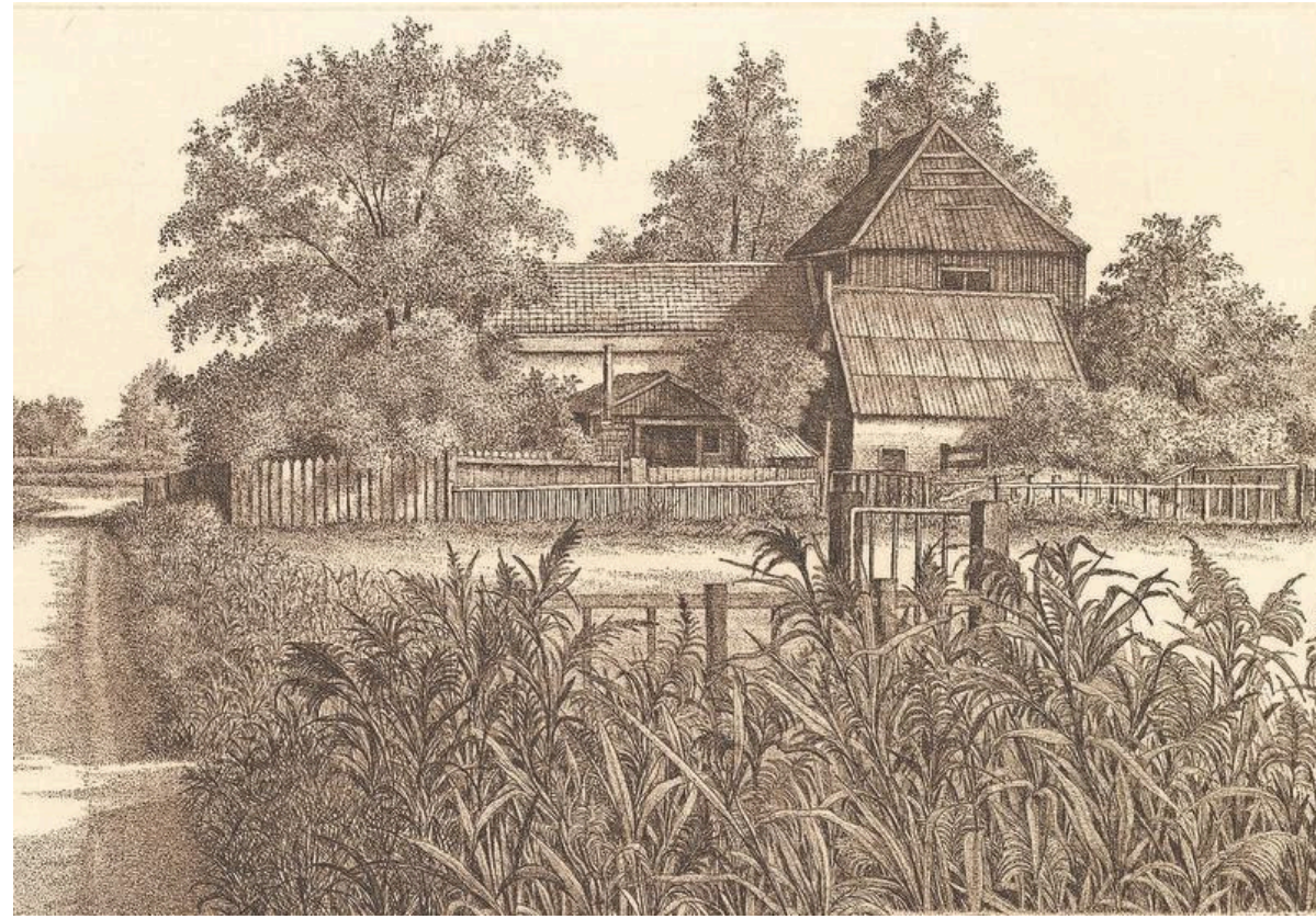
Boerderij tussen Krommenie en Uitgeest (2002).

KUNST Speurtocht naar onbekende etser en fotograaf