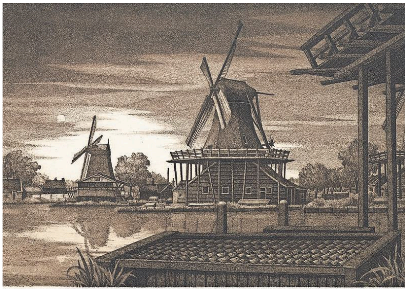
Late avond Zaanse Schans III (2001).