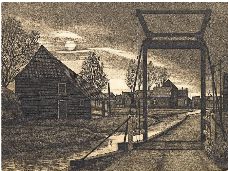
Late avond in Oostzaan (1994).