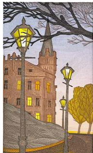
Arkady Pugachevsky, Kiev, plasticgrave, 1994.