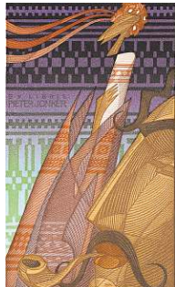
Gennady Pugachevsky, Ukrainian Folklore, negen kleuren plastic grave, 1994.