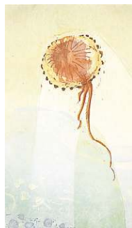
'Aangespoel', 40x90 cm.