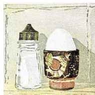
'Inséperable', 10x10 cm.

Zelf pakte hij zijn mondharmonica. Een tweede gewaardeerd muzikaal optreden werd verzorgd door Pelle Kuipers. Hij zong drie nummers waarbij hij zelf voor gitaarbe-